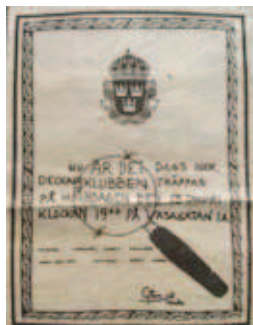
Smådeckare rekryterades bland annat via flygblad på Sverkerskolan.