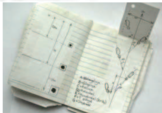
Blodspår och fotstegsanalys. Deckarna klippte, klistrade och antecknade intill kopierade blad de fått av Göran. Boken blev en blandning av detaljer från den kriminella världen, deckarens hjälpmedel och chiffer. T.v. Blodspår ser olika ut beroende av fallhöjd, T.h. Fotavtrycksanalys.