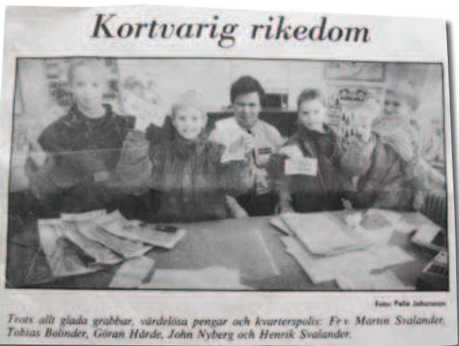
Notis i UNT.

– Många gånger fick jag ha tolk med mig. Jag kände att jag hade en viktig uppgift. Gör man ett bra förebyggande arbete så blir det inga problemområden. Att bygga långvariga relationer med vuxna, barn och