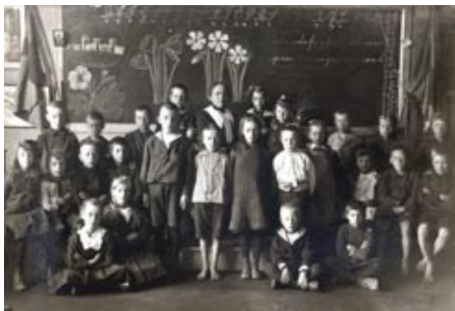
En av de första skolklasserna på folkskolan 1905.