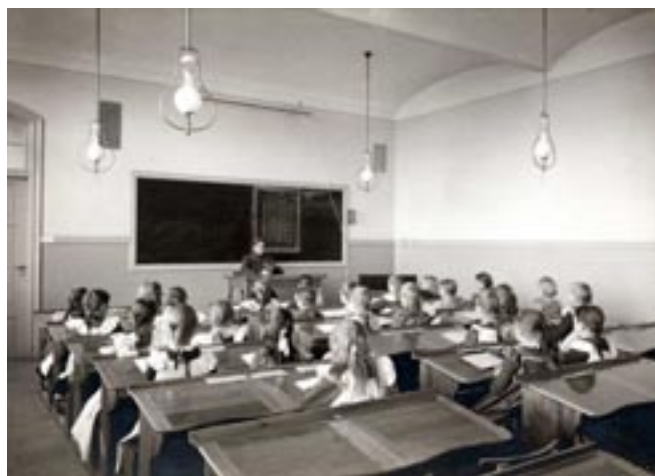
Skolklass med Amelie Bolin.