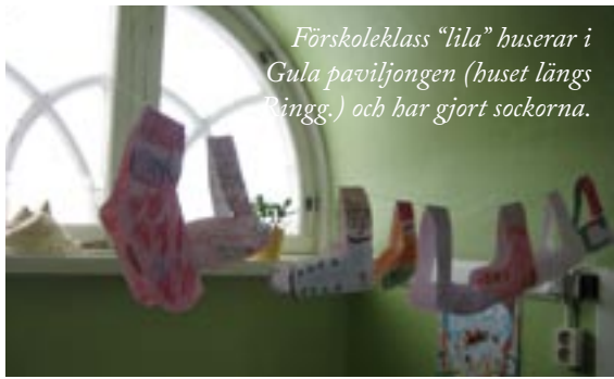
Förskoleklass "lila" buserar i Gula paviljongen (huset längs Ringg.) och har gjort sockorna.