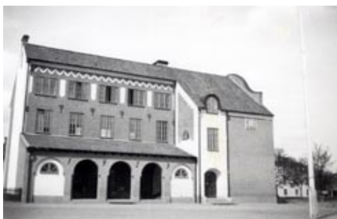
Gula paviljongen med sin vänstra nakna gavel. Längs långsidan syns arkadordningen med tre bågar som utgör förhall vid ingången till gymnastiksalen.