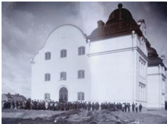
Den majestätiska folkskolebyggnaden står klar på luthagsk åkermark hösten 1905.

och tvättas därför varje dag efter slutat dagsarbete med våt borste. Beträffande inredningen må nämnas ett par nyheter som varit mycket efterfrågade från andra håll nämligen svarta tavlor av linoleum fastklitrade direkt på väggen och kart- samt planschhängare av en synnerligen enkel och ändamålsenlig konstruktion, som medger många variationer tar ingen plats och bildar inga dammgömmor. Damm kan heller icke uppröras vid användning av sv tavlan, enär allt bortskaffande av det skrivna sker medelst våt gummisvamp.