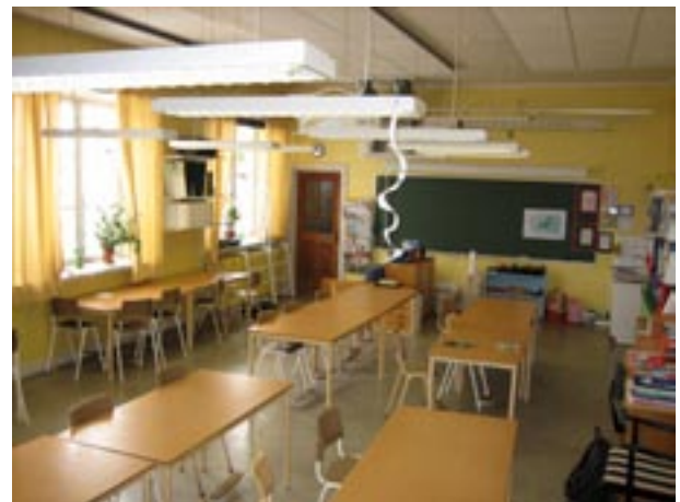
Ett klassrum i Gula paviljongen.